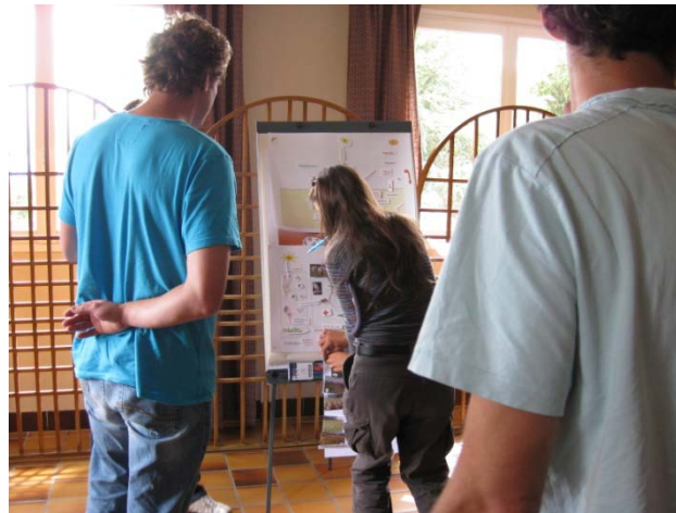
Photo 1. Exercice de reconstitution dans un sous groupe.