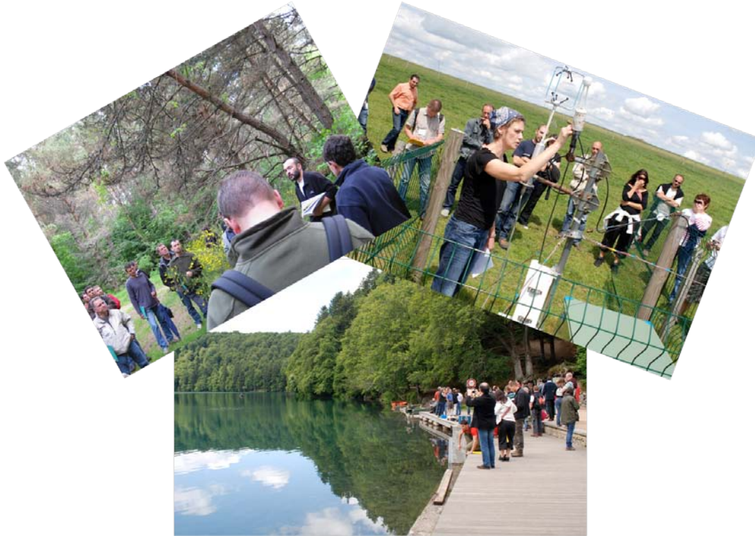
Photo 3. Visites sur les 3 écosystèmes forestiers prairiaux et aquatiques.