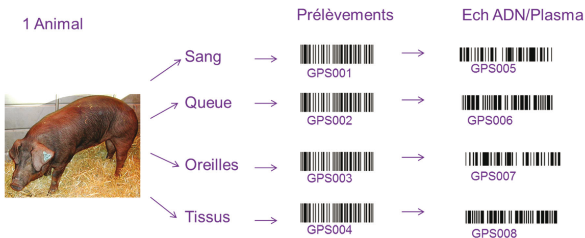
Figure 1. Illustration des différents types d'échantillons identifiés par codes-barres qui sont produits au cours d'un protocole expérimental et filiation. Un contenant = un code-barres, même si un tissu est prélevé 2 fois (exemple prélèvement de sang).

À GenPhySE, ces prélèvements sont ensuite traités et des dérivés (ADN, ARN, plasma...) sont créés pour réaliser les analyses nécessaires. Toute cette filiation est enregistrée dans Barcode ( Figure 1 ).