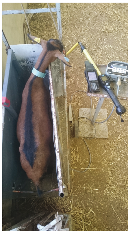
Figure 2. Les outils de saisie de données en situation sur l'élevage de l'UE Bourges (photos : T. Fassier).