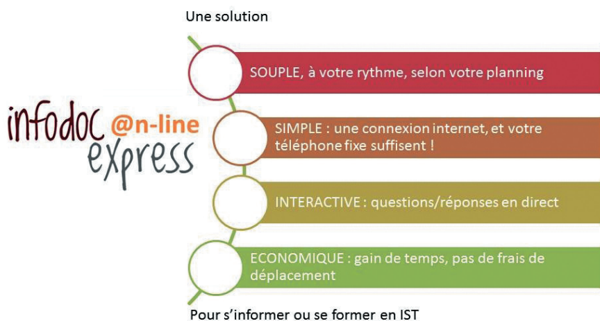
Figure 4. La solution Infodoc-express en ligne.