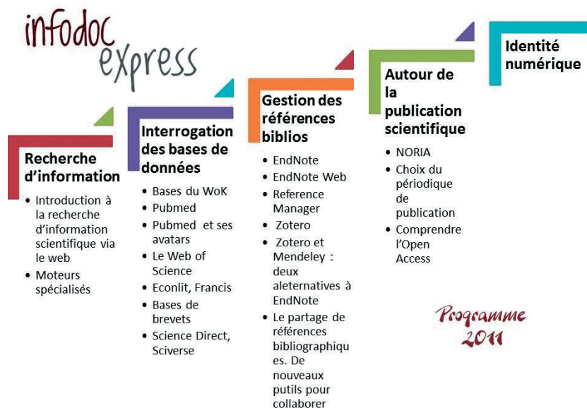
Figure 3. Les sujets des Infodoc express en 2011.

Les principaux sujets abordés dans les Infodoc express sont présentés sur la Figure 3.