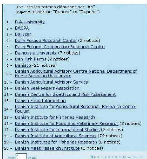
Figure 3. Index "Affiliation externe" après le chantier de correction.

L'homogénéisation consiste à corriger les fautes de frappe, d'orthographe et à supprimer les doublons. Ainsi les index et les référentiels nettoyés favorisent la recherche tout en limitant les possibilités d'erreurs pour les saisies ultérieures. La Figure 3 montre l'index documentaire pré-cité après ces corrections. C'est un véritable cercle vertueux qui se met en place.